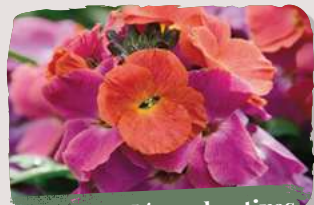
Les giroflées arbustives

Resistantes à la sécheresse et au froid, adaptées à tous types de sols, elles préfèrent les espaces ensoleillés.