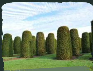
Le charme (Carpinus Betulus)

On l'appelle aussi chèvrefeuille à feuille de buis de par leur ressemblance. Il reste une très bonne alternative au buis . Il pousse rapidement en émettant des rameaux grêles couverts de petites feuilles foncées sur le dessus et claires au revers. La taille doit être répétée plusieurs fois par an. Se cultive également en bac dans un sol pas trop sec.