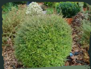
Le chèvrefeuille arbustif (Lonicera nitida)

On l'appelle aussi chèvrefeuille à feuille de buis de par leur ressemblance. Il reste une très bonne alternative au buis . Il pousse rapidement en émettant des rameaux grêles couverts de petites feuilles foncées sur le dessus et claires au revers. La taille doit être répétée plusieurs fois par an. Se cultive également en bac dans un sol pas trop sec.