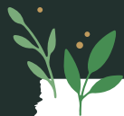
Le troène du Yunnan (Ligustrum Jonandrum)

Le charme a la particularité de garder son feuillage d'automne (brun-orangé) tout au long de l'hiver, avant la pousse des nouvelles feuilles vertes au printemps. Il est bien adapté aux climats frais et n'est donc pas très friand du climat méditerranéen et du bord de mer. Taillez-le au printemps pour lui donner la forme voulue. Une seconde taille d'entretien doit se réaliser en fin d'été. Ne taillez pas pendant les gelées.